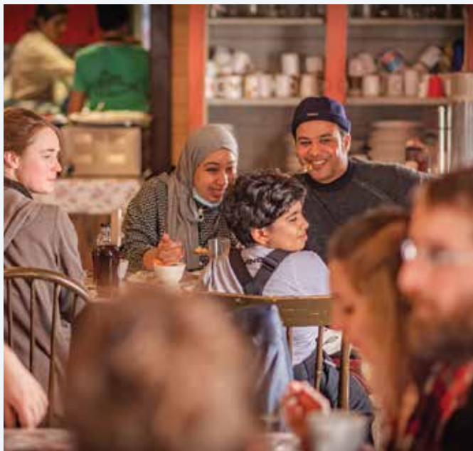
Activité d'accueil à la cabane à sucre - MRC de Kamouraska.