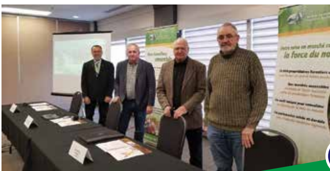
Conférence de presse tenue en décembre 2021. De gauche à droite :

C'est dans le cadre des travaux de la Table de concertation sur la forêt privée (TCFP), coordonnée par le CRD, qu'une importante mobilisation a été réalisée sur l'enjeu de l'épidémie de la tordeuse des bourgeons de l'épinette. Grâce à l'appui politique de la Table régionale des élu(e)s municipaux du Bas-Saint-Laurent (TREMBSL), les organisations représentant les propriétaires de boisés privés ont lancé un appel à l'action au gouvernement pour en contrer les effets dévastateurs. Avec la collaboration de la TREMBSL, des lettres suivies de représentations politiques ont été réalisées auprès des instances concernées, alors qu'une conférence de presse était tenue un peu avant la période des Fêtes. Au printemps 2022, les partenaires ont reçu favorablement les ajouts budgétaires de près de 4,8 M $ pour des travaux de plantation (rétroactivement pour l'année 2021). Ils demeurent toutefois vigilants pour combler pleinement les besoins liés à l'épidémie et la réalisation de la stratégie sylvicole pour les prochaines années.