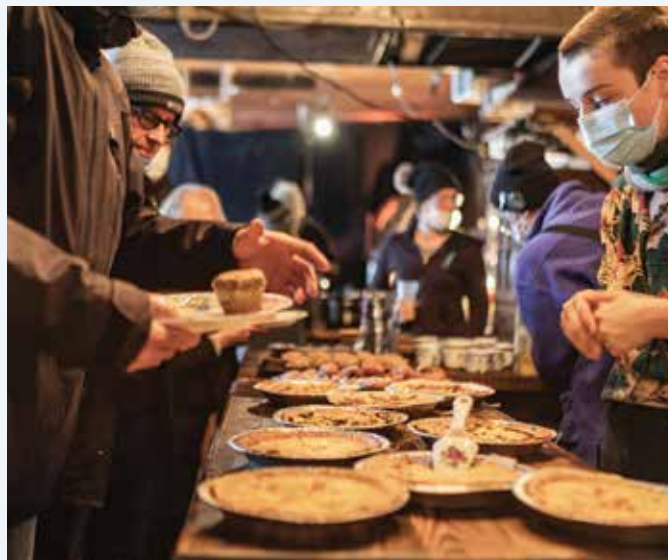
Brunch intergénérationnel du Comité de lutte aux préjugés (CLAP) de la MRC des Basques.

Les huit MRC du Bas-Saint-Laurent: 80 000$