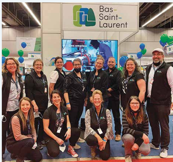
L'équipe du Bas-Saint-Laurent en opération séduction au Salon de l'emploi et de la formation continue, à Montréal.

Le slogan « Tout ça. Pour toi. » et la nouvelle plateforme promotionnelle bas-saint-laurent.org invitent les personnes à imaginer leur futur en territoire bas-laurentien.