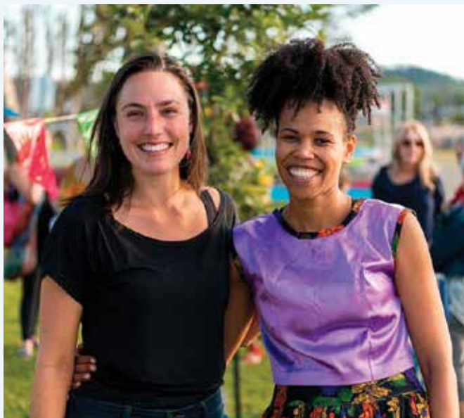
Service d'accueil des nouveaux arrivants de La Matanie.

Collectif régional de développement: 35 640 $