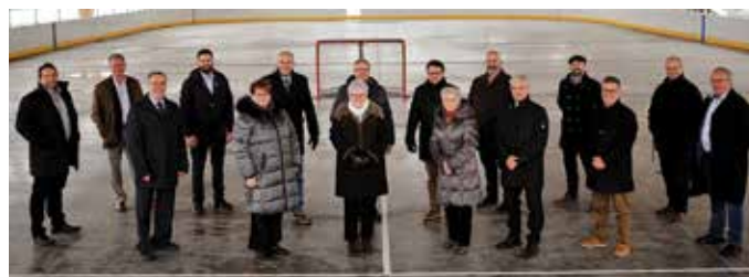
La TREMBSL regroupe les huit préfets des MRC, ainsi que les dix maires et mairesses des cités régionales et des villes de centralité de la région.