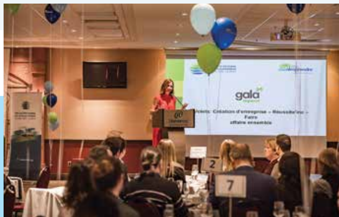
Gala régional du Défi OSEntreprendre tenu à Rivière-du-Loup.

Cégep de La Pocatière, Extra Formation: 1500 $