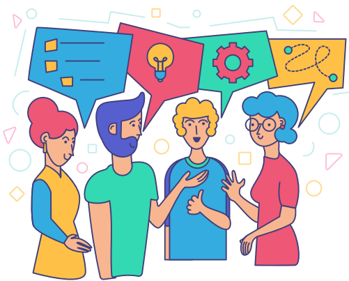
Table régionale de l'Alliance pour la solidarité et l'inclusion

13 mai 2022 : dépôt concerté de nouveaux projets et prolongement des initiatives déjà entamées